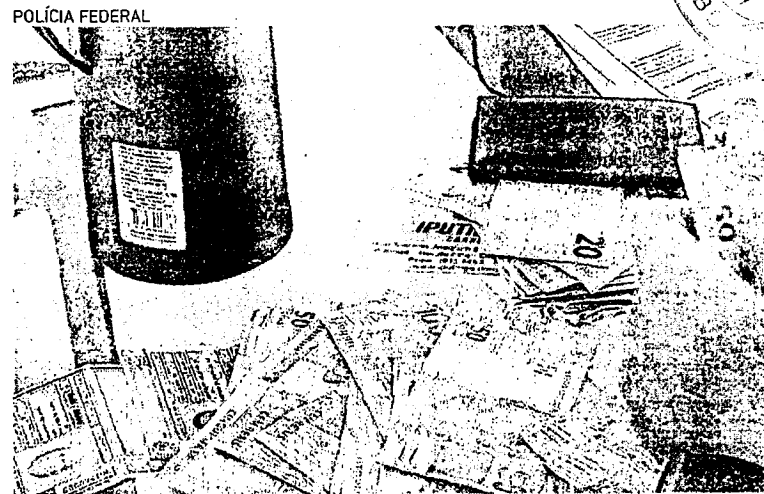
OPERAÇÃO foi desencadeada pela PF em quatro estados; dinheiro foi apreendido

A Polícia Federal (PF) deflagrou, nessa terça-feira, 12, a Operação Rebote para investigar um esquema envolvendo tráfico de drogas e lavagem de dinheiro nos estados do Ceará, Pernambuco, Paraíba e São Paulo. Conforme as investigações, os suspeitos movimentaram cerca de R$ 77 milhões em operações financeiras irregulares e em aquisição de bens. De acordo com a