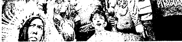
INSTALAÇÃO dos marcos nos municípios de Maracanaú e Pacatuba

O Acordo foi assinado pela Fundação Nacional dos Povos Indígenas (Funai), pelo Instituto do Desenvolvimento Agrário (Idace) e Secretaria dos Povos Indígenas do Ceará (Sepince).