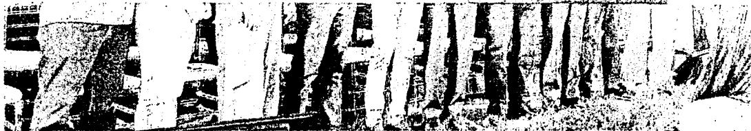
MEC ressaltou que a expectativa é que o Hospital da UFC esteja em funcionamento em 2026

Estado do Ceará - Prefeitura Municipal de Quixeré - Aviso de Licitação - Concorrência Eletrônica nº 0005/2024 - SEDUC. A Secretaria de Educação comunica aos interessados que