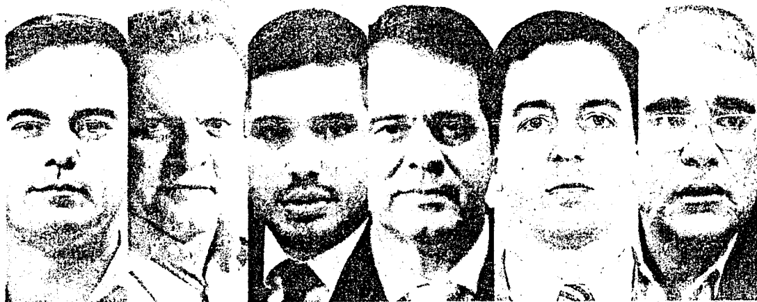
PRIMEIRA pesquisa Datafolha para Prefeitura de Fortaleza foi divulgada nesta quinta, 27