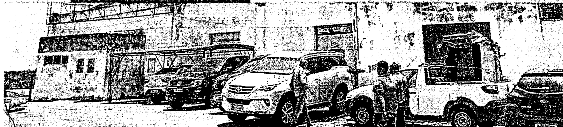
ESTRUTURA do Terminal Pesqueiro do Porto de Camocim necessita de revitalização