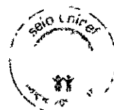
FRANCISCO DAS CHAGAS PARENTE AGUIAR PREFEITO MUNICIPAL DE MUCAMBO