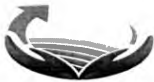
TABELA DE AJUDAS DE CUSTO