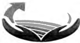
TABELA DE DIÁRIAS